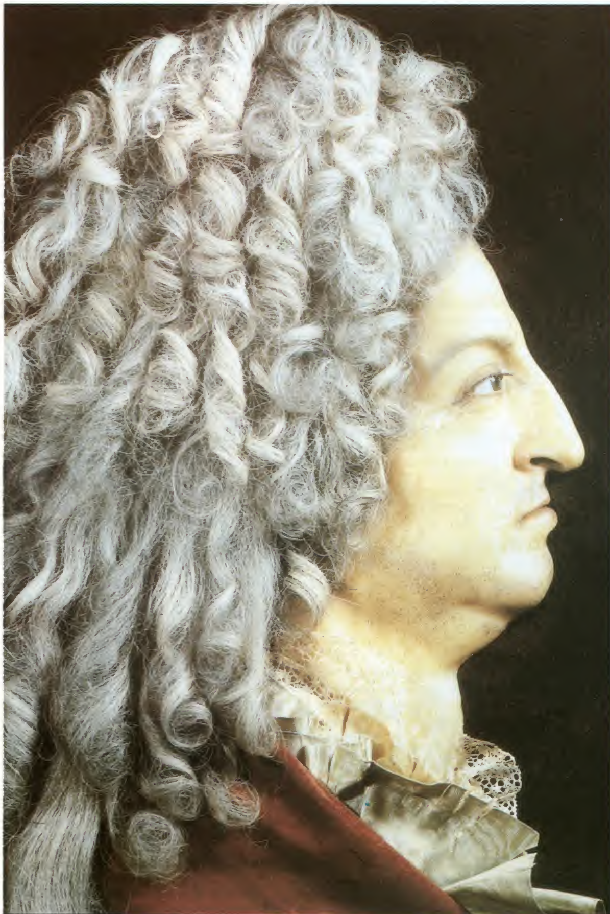
Retrato de Luis XIV, hacia 1710 (por Antoine Benoist, Museo de Versalles)